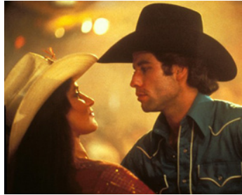
1980 URBAN COWBOY (Urban Cowboy) de James Bridges avec Debra Winger