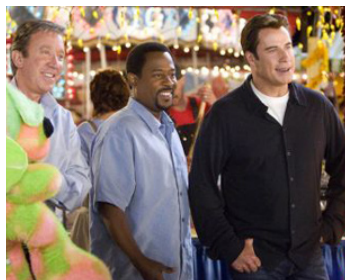
2007 BANDE DE SAUVAGES (Wild Hogs) de Walt Becker avec Martin Lawrence