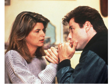
1990 ALLO MAMAN ICI BÉBÉ ! (Look who's talking) d'Amy Heckerling avec Kirstie Alley