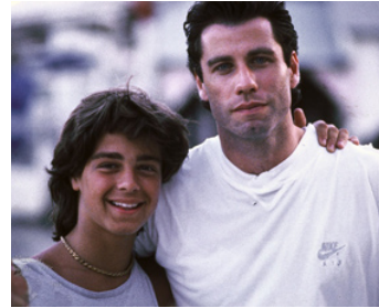
1991 RÉCLUSION À MORT (Chains of Gold) de Rod Holcomb avec Joey Lawrence