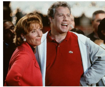
1998 PRIMARY COLORS (Primary Colors) de Mike Nichols avec Emma Thompson