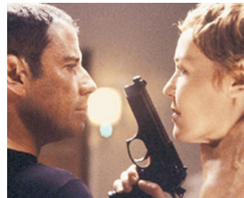
2003 BASIC (Basic) de John McTiernan avec Connie Nielsen