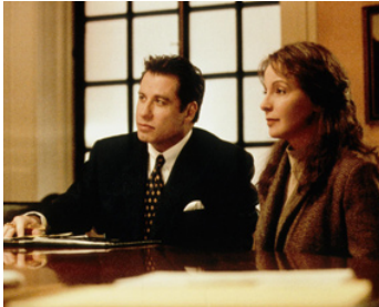
1998 PRÉJUDICE (A Civil Action) de Steven Zaillian avec Kathleen Quinlan