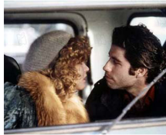
1981 BLOW OUT (Blow Out) de Brian De Palma avec Nancy Allen