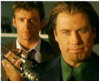
2001 OPÉRATION ESPADON (Swordfish) de Dominic Sena avec Hugh Jackman