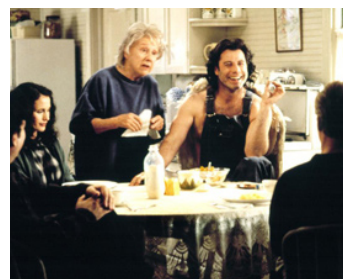
1996 MICHAEL (Michael) de Nora Ephron avec Andie MacDowell, Jean Stapleton