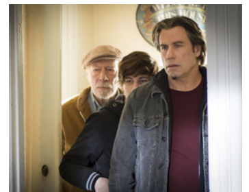
2014 THE FORGER (The Forger) de Philip Martin avec Christopher Plummer, Tye Sheridan