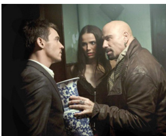
2010 FROM PARIS WITH LOVE de Pierre Morel avec Jonathan Rhys-Meyers, Amber Rose Revah