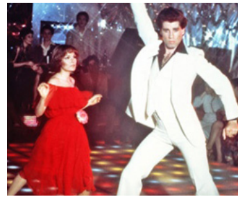
1977 LA FIÈVRE DU SAMEDI SOIR (Saturday Night Fever) de J. Badham avec Karen Lynn Gorney