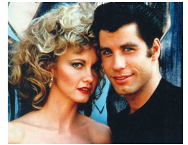
1978 GREASE (Grease) de Randal Kleiser avec Olivia Newton-John