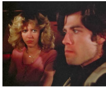
1976 CARRIE AU BAL DU DIABLE (Carrie) de Brian De Palma avec Nancy Allen