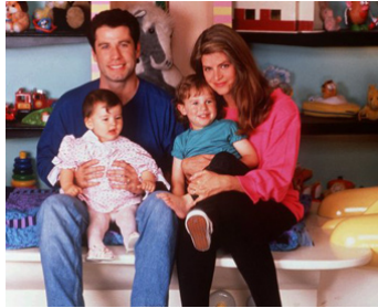
1990 ALLO MAMAN, C'EST ENCORE MOI ! (Look who's talking too) d'A. Heckerling avec K. Alley