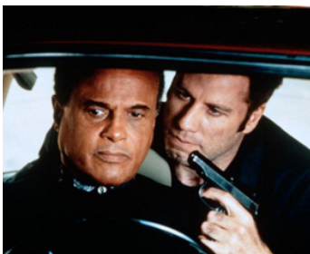
1995 WHITE MAN (White Man's Burden) de Desmond Nakano avec Harry Belafonte