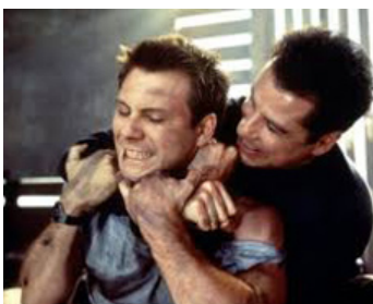
1996 BROKEN ARROW (Broken Arrow) de John Woo avec Christian Slater