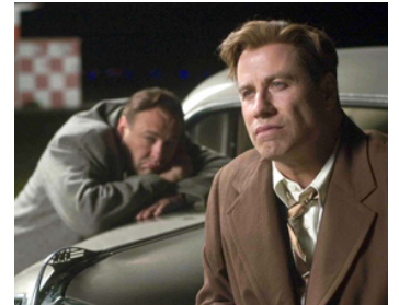
2006 CŒURS PERDUS (Lonely Hearts) de Todd Robinson avec James Gandolfini