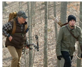
2013 FACE À FACE (Killing Season) de Mark Steven Johnson avec Robert De Niro