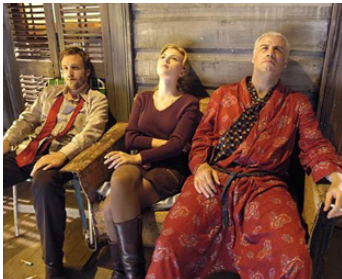
2004 LOVE SONG (A Love Song for Bobby Long) de Shaínee Gabel avec Gabriel Macht, S. Johansson