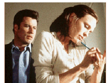
1997 SHE'S SO LOVELY (She's so lovely) de Nick Cassavetes avec Robin Wright Penn