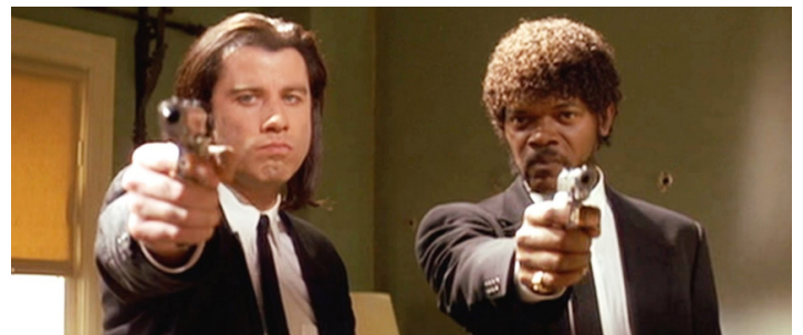
1994 PULP FICTION (Pulp Fiction) de Quentin Tarantino avec Samuel L. Jackson