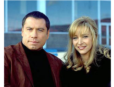
2000 LE BON NUMÉRO (Lucky Numbers) de Nora Ephron avec Lisa Kudrow