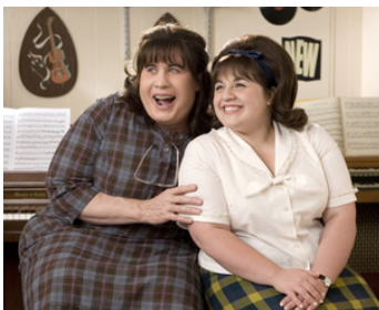
2007 HAIRSPRAY (Hairspray) d'Adam Shankman avec Nikki Blonsky