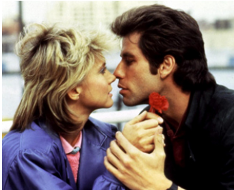
1983 SECONDE CHANCE (Two of a Kind) de John Herzfeld avec Olivia Newton-John