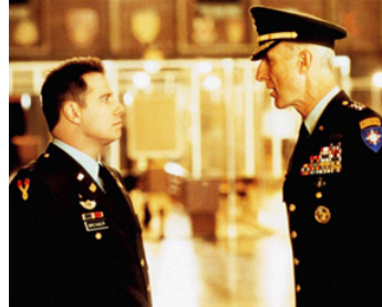
1999 LE DÉSHONNEUR D'ELISABETH CAMPBELL (The General's Daughter) de S. West avec James Cromwell