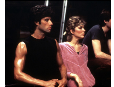
1983 STAYING ALIVE (Staying Alive) de Sylvester Stallone avec Cynthia Rhodes