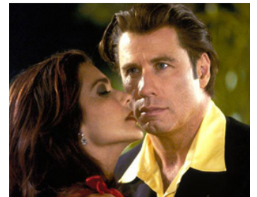
2004 THE PUNISHER (The Punisher) de Jonathan Hensleigh avec Laura Elena Harring