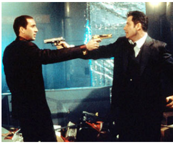
1997 VOLTE FACE (Face//Off) de John Woo avec Nicolas Cage