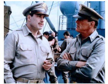
1998 LA LIGNE ROUGE (The Thin Red Line) de Terrence Malick avec Nick Nolte