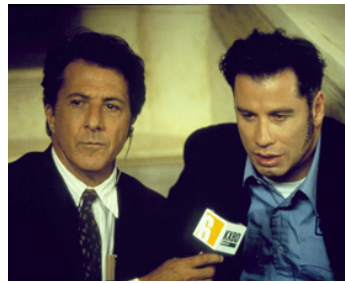
1997 MAD CITY (Mad City) de Costa-Gavras avec Dustin Hoffman