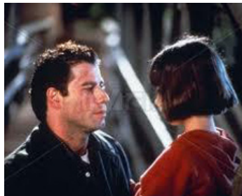
1991 LES YEUX D'UN ANGE (Eyes of an Angel) de Robert Harmon avec Elli Raab