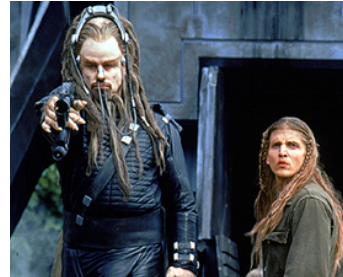
2000 TERRE, CHAMP DE BATAILLE (Battlefield Earth) de Roger Christian avec Barry Pepper