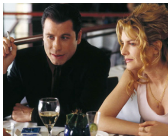
1995 GET SHORTY, STARS ET TRUANDS (Get Shorty) de Barry Sonnenfeld avec Rene Russo