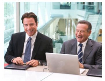
2009 LES DEUX FONT LA PÈRE (Old Dogs) de Walt Becker avec Robin Williams