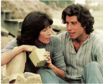
1978 LE TEMPS D'UNE ROMANCE (Moment by Moment) de Jane Wagner avec Lily Tomlin