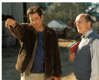
1996 PHÉNOMÈNE (Phenomenon) de Jon Turteltaub avec Robert Duvall