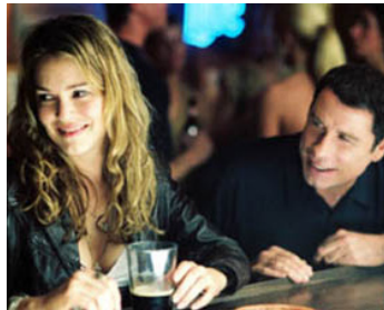
2004 PIÈGE DE FEU (Ladder 49) de Jay Russell avec Jacinda Barrett