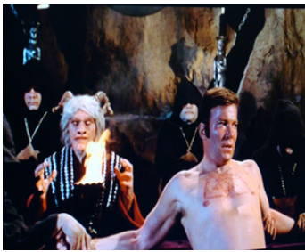
1975 LA PLUIE DU DIABLE (The Devil's Rain) de Robert Fuest avec William Shatner